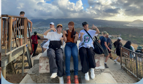
ダイヤモンドヘッドの展望台にて