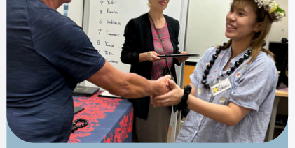
研修プログラム修了式