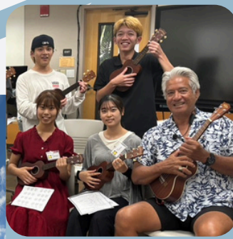
ウクレレレッスン