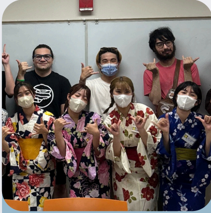
浴衣を着て鹿児島を紹介